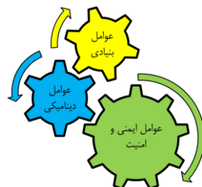
شکل شماره ۱. عوامل اصلی رویکرد ساختارگرا در امنیت شهری (بلیک و همکاران، ۲۰۰۳)

رهیافت‌های ایمنی و امنیت در تأمین امنیت شهری: در بین رهیافت‌های ارائه‌شده برای امنیت یکی از کاربردی‌ترین رهیافت‌ها، رویکرد ساختارگرا می‌باشد. داشتن رویکرد ساختارگرا بر مقوله امنیت، از جمله فعال‌ترین فلسفه‌های مکانی - فضایی در تحلیل مفاهیم انسانی در راستای موضوع ایمنی و امنیت در چند دهه اخیر محسوب می‌شود. مکتب فکری حاضر که از طریق رابطه بین سوانح، سطح توسعه و وابستگی اقتصادی جهان در حال توسعه نشأت می‌گیرد بر این اصل استوار است که افزایش گرفتاری‌های کشورهای جنوب بیشتر به سبب توجه افراد به امور اقتصاد جهانی، گسترش سرمایه‌داری و در حاشیه قرار گرفتن مردم فقیر است تا اثر حوادث ژئوفیزیکی (اقبال، ۱۳۹۴: ۳۳). از مهم‌ترین نظریه‌پردازان این رویکرد می‌توان به توبین و مونتر اشاره کرد که در سال ۱۹۹۷ با نگاهی ساختاری روند شکل‌گیری و تشدید آسیب‌های مکانی را متأثر از سه اصل عمده به شرح شکل زیر تحلیل کرده‌اند.