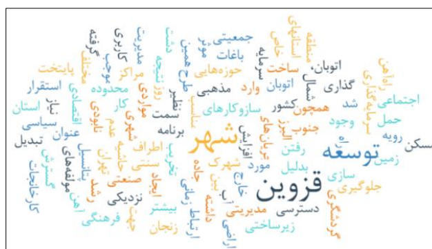
شکل ۲. ابر داده، واژگان تبیین‌کننده مرتبط با عوامل تخریب باغ‌های سنتی

علاوه بر سطح‌بندی مقوله‌ها، کدهای مفهومی و کدهای فرعی، تحلیل دیگری نیز در این پژوهش ارائه شده است که بر مبنای تحلیل واژگان مورد استفاده کارشناسان و متخصصین حوزه عوامل تخریب باغ‌های سنتی بوده است. بر این اساس ۱۱۳۴ رکورد و ۴۸۴ رتبه شناسایی شده است. از این بین تنها تا رکورد ۶۳ و رتبه ۴۵، که مهم‌ترین موارد بوده‌اند ارائه شده است. هم‌چنین، ابر داده واژگان تبیین‌کننده تخریب باغ‌های سنتی به‌قرار شکل زیر ارائه شده است.